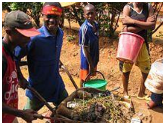
Wolontariusze pracujący w Afryce